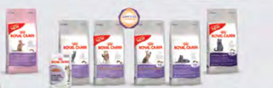
Maintenant tous les chats stérilisés ont toutes les raisons d'être en bonne santé.

Pour toutes informations complémentaires sur cette gamme