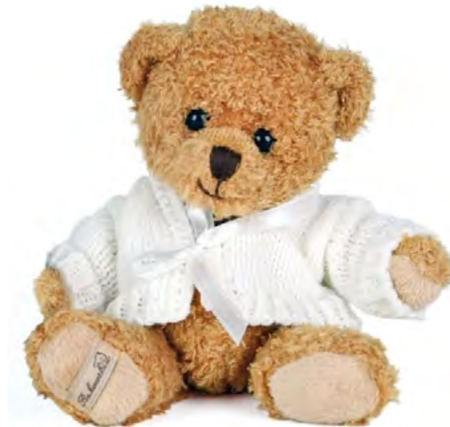
Ours en peluche