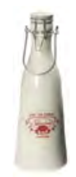
Bouteille de lait 95 cl - 10,99€ 3453831101205