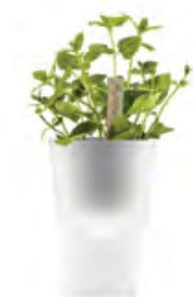
Pot à réserve d'eau Ø 11 cm - 34,90€ 5706631043588