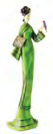
Statue femme Asiatique Hauteur 50 cm 64,90€ 3533594001506