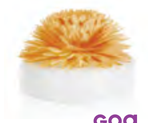
GOA Coffret fleur de Goatier Miel - Vanille - 200 ml 20,99€ 3583090289076