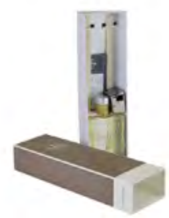
Diffuseur d'ambiance The imperial 39,90€ 3533598001649