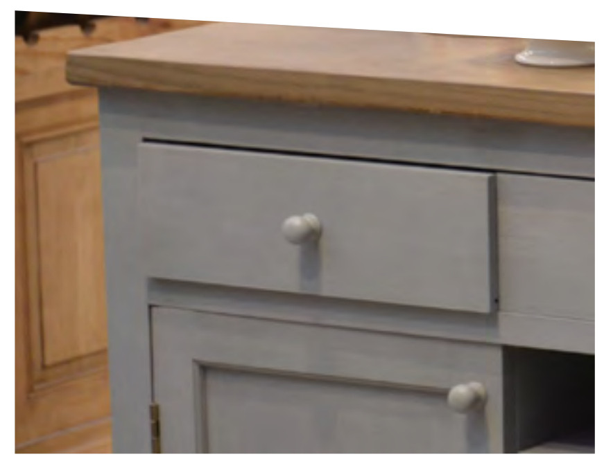
Buffet Bocage Dim. 110x45x90 cm 549€ 3453831281303