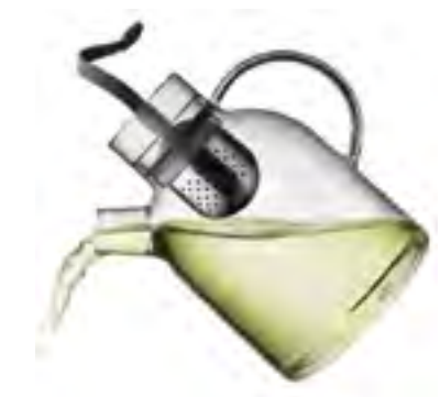
Theière Kettle Avec boule à thé - 54,90€ 5709262950553