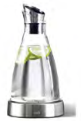
Carafe fraîcheur Flow 1 L - 39,90€ 4009049232782