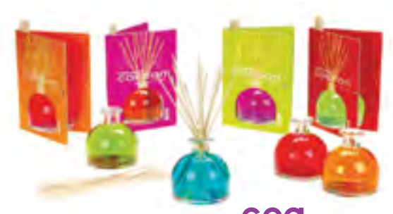
Goatier Fleur de Tiaré - 250 ml 14,99€ 3583090228051