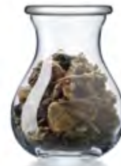
Bocal à épicerie 1 L - 34,90€ 5706631034241