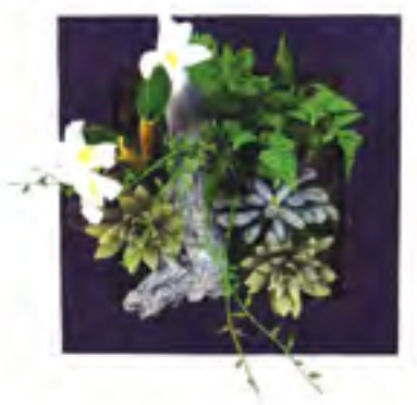
Cadre vegetal orchidees Dim. 30x30 cm 79,90€ 3533596170033