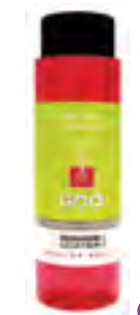
GOA Recharge Goatier Macaron/Framboise - 260 ml 8,99€ 3583090234267