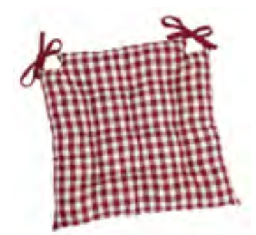
Galette de chaise Dim. 40x40 cm 15,59€ 3453831132209