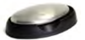
Savon en inox 12,99€ 4008832631139