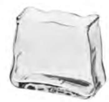
Vase Talinn Dim. 19x12 cm 22,99€ 3533597027107