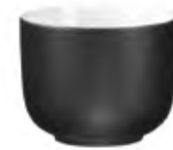
Bol à thé Grand modèle - 9,99€ 4024433289159