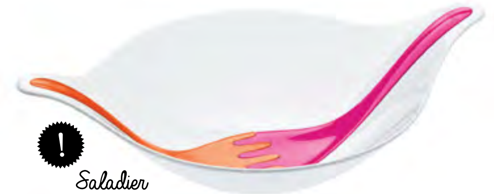
! Saladier 'Leaf' Medium - 34,99€ 4002942239957