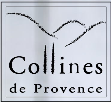
Bouquet fleuri 25,49€ 3700305870076