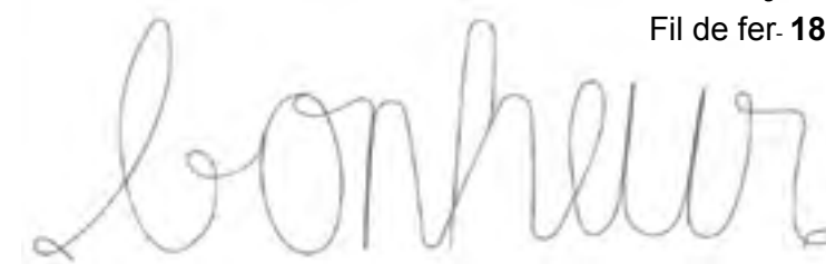
Mot 'bonheur' Fil de fer - 18,49€ 3100070540714