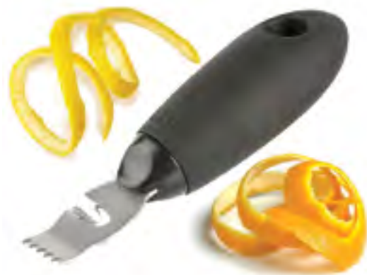
Zesteur 9,49€ 0719812267814