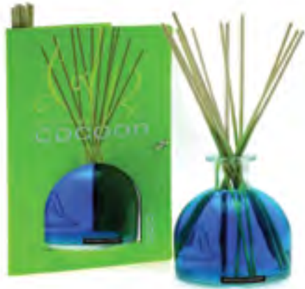
Goatier 'Cocoon' 250 mL - 15,99€ 3583090228082 Soit 63,96€ le litre