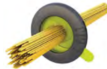
Mesure-spaghetti 11,49€ 5028420092950