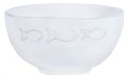
Bol 12,99€ 3100070690426