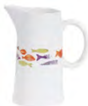
Pichet Haut. 21 cm - 18,99€ 3100070682537