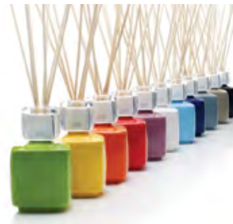
Arbre à senteurs Walter baby - 16,99€ 8034049924784