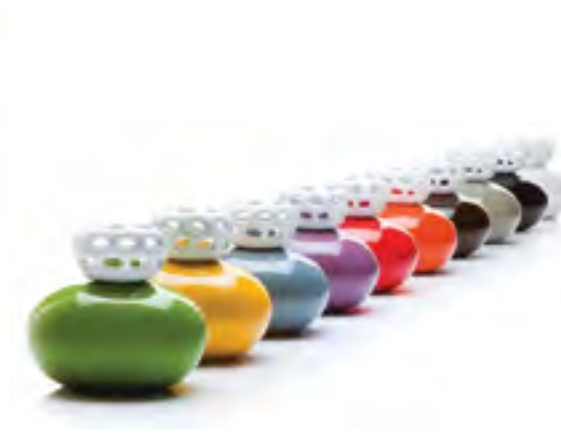
Arbre à senteurs Ginger - 29,99€ 8034049921530