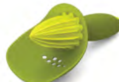
Presse-agrume 12,49€ 5028420095463