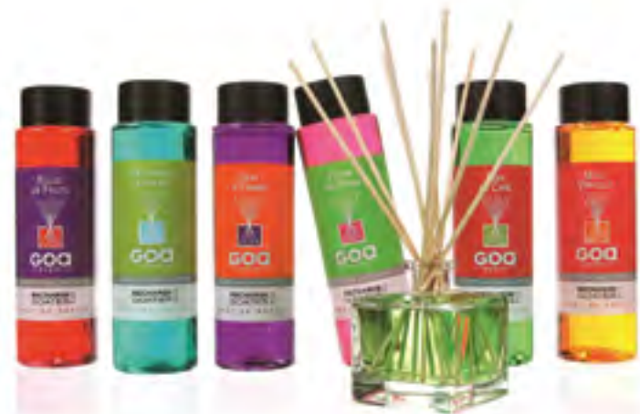
Goatier 'Cub' 80 mL - 8,19€ 3583090888026 Recharges non fournies - Soit 102,375€ le litre