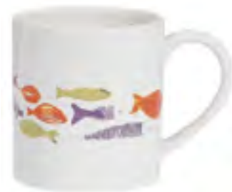
Mug Haut. 10 cm - 5,99€ 3100070682544