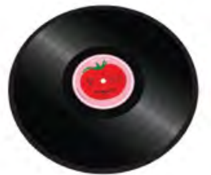
Planche à découper 28,99€ 5028420900026