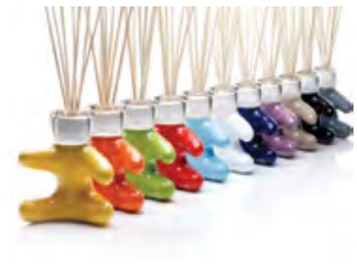
Arbre à senteurs Vito - 34,99€ 8034049923077