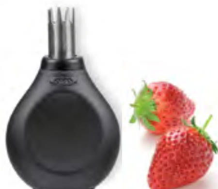
Equeuteur fraise/tomate 6,49€ 7198120227278