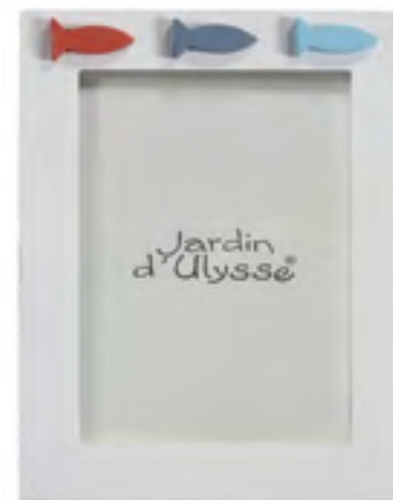
Cadre photo Petit modèle - 12,49€ 3100070436277

Les collections Jardin d'Ulysse sont fabriquées artisanalement et reposent, pour la plupart, sur des savoir-faire ancestraux. Un véritable partenariat avec des artisans qui accompagnent depuis ses origines le développement de Jardin d'Ulysse.