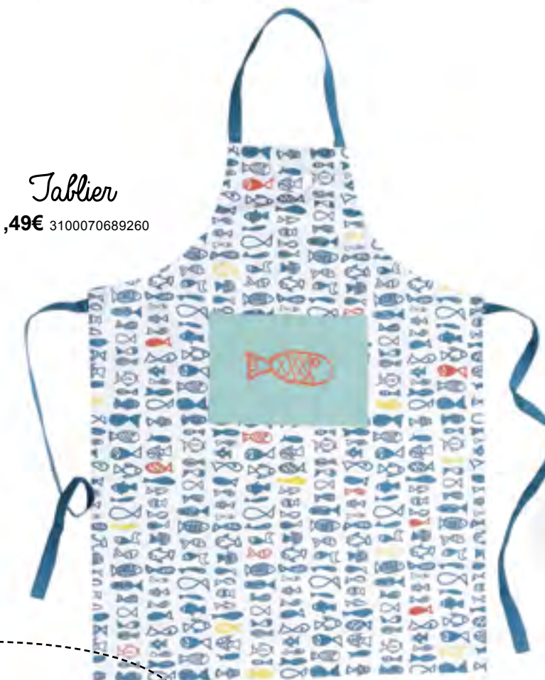
Tablier 21,49€ 3100070689260