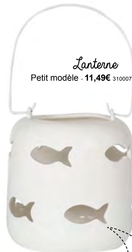
Lanterne Petit modèle - 11,49€ 3100070682568