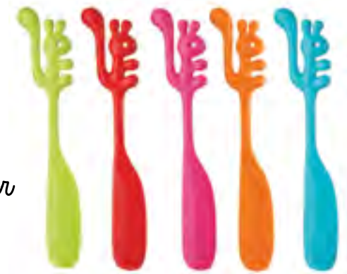
Cuillère à tartiner 4,49€ 4002942141779