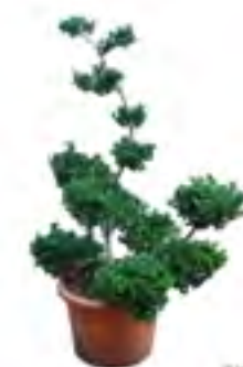
Ilex Crenata Pépinière - 40 litres 149,00€ 8033103287155