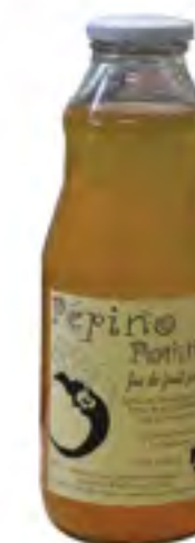
AB Jus de pomme bio 1 litre 3,79€ 2000000044767

*L'ABUS D'ALCOOL EST DANGEREUX POUR LA SANTÉ. A CONSOMMER AVEC MODÉRATION.