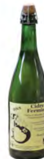
AB Cidre bio 75 cL - 3,79€ 2000000044736 Soit 5,05€ le litre