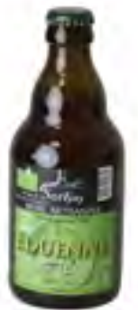
Bière blonde bio 33 cl "Eduenne" 2,59€ 3700232170331 Soit 7,85€ le litre

Bière médiévale de haute fermentation à 4,8% vol. faite à base de malts d'orges, de malt de blé et par infusion de cèpes secs à l'ébullition au brassage. Brassage durant huit heures, fermentation principale à 20°C sur huit jours et mise en garde à 4°C pendant dix jours. Conditionnée en fût après filtration, flashpasteurisation et carbonatation. Conditionnée en bouteille avec la technique de refermentation 'trappiste' en chambre chaude pendant dix jours. C'est une bière à découvrir, elle surprend par sa richesse aromatique, des notes boisées un peu salées développées par les cèpes. Une amertume fine s'exprime en fin de bouche.