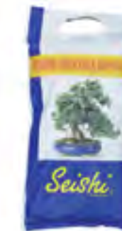
Terreau Bonsaï Seishi - 30 L