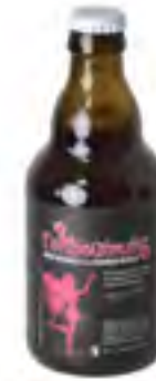
Bière à la framboise 33 cl "l'envouteuse" 2,59€ 2090000122701 Soit 7,85€ le litre