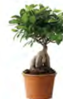
Ficus Ginseng Pot Ø25 cm 59,99€ 8717232321934