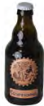
Bière cuivrée 33 cl " Egyptienne" 2,39€ 3700232080333 Soit 7,24€ le litre