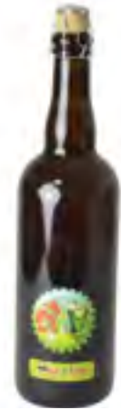
Bière médiévale 75 cl " Salve Garde" 5,19€ 3700232070754 Soit 6,92€ le litre