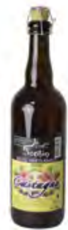
Bière ambrée 75 cl " Castagne" 5,19€ 3700232110757 Soit 6,92€ le litre