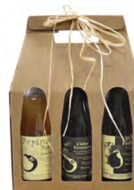
AB Panier dégustation Cidre + jus de pomme 12,99€ 2000000044774