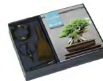
Coffret Art du Bonsaï

Cette technique, qui consiste à tailler les feuilles (retirer les feuilles sans ôter leurs pétioles) devra être effectuée seulement sur les Bonsaï en bonne santé n'ayant pas subi de repotage, de taille de structure ou bien de ligaturage au risque de le fatiguer. Elle s'adresse principalement aux Bonsaï à feuilles caduques (période idéale : juin).