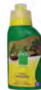
Engrais Bonsaï BHS - 300 ml