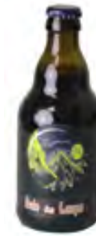
Bière rosée 33 cl " Baie des loups" 3,09€ 3700232220333 Soit 9,36€ le litre